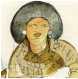
La vieille Benoîte

Relie le nom du personnage à sa presqu'île.